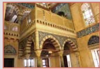
Хюнкар Махфили (Ложата на Владетеля)