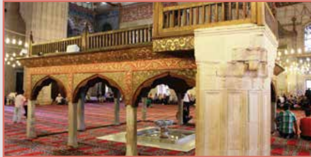
Мюезина Махфили (Ложата на Мюезина)

Мимбар изглежда като високо стълбище, но всъщност се използва като издигната платформа за изнасяне на проповед по време на конгрегационни молитвени дни. Това са: всеки петък по обяд; по време на празниците Рамадан байрам и Курбан Байрам. При тези три случая всички здрави мюсюлмани се насърчават да присъстват на събранието и посетителите достигат около шест хиляди вътре в основната зала. От това високо местоположение имаът може да се види и чуе лесно от поклонниците вътре.