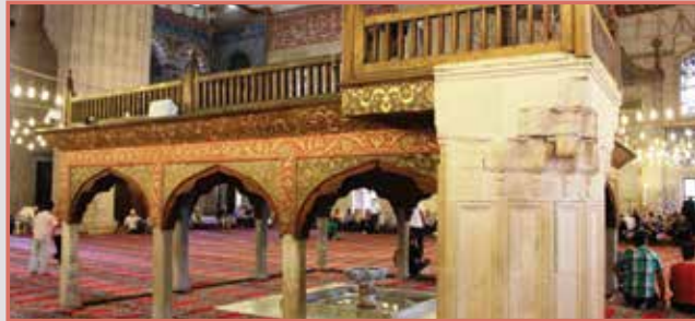
Μουεζίν Μαχφίλι (Η Στοά του Μουεζίν)

Το Μυμπέρ μοιάζει με μια ψηλή σκάλα, ωστόσο χρησιμοποιείται ως ανεβασμένη έδρα για παράδοση του κυρήγματος σε μαζικές μέρες προσευχής. Αυτές είναι κάθε Παρασκευή ώρα απογεύματος, στην Γιορτή του Ραμαντάν και την Γιορτή της Θυσίας. Σε αυτά τα τρία κύρια προσκνήματα που εκτελούνται μαζικά, όλοι οι υγιείς μουσουλμάνοι ενθαρρύνονται να πάρουν μέρος στη σύναξη και οι αριθμοί αγγγίζουν περίπου τις 6 χιλιάδες μέσα στο κύριο χώρο. Από αυτή την ψηλή τοποθεσία του μυμπέρ φαίνεται και ακούγεται εύκολα ο «Ιμάμ» από τους προσκνητές που βρίσκονται στο εσωτερικό του τεμένου.