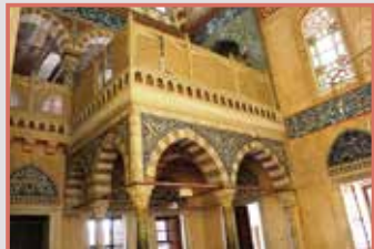
Χουνκάρ Μαχφίλι (Η βασιλική στοά)